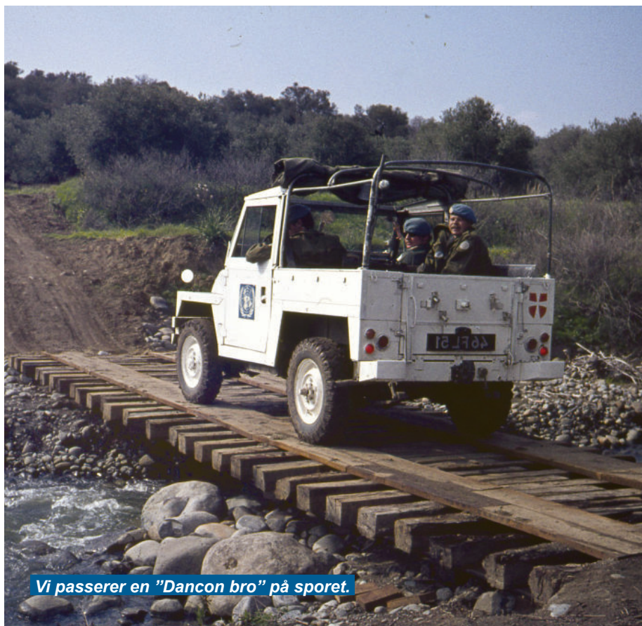
Vi passerer en ”Dancon bro” på sporet.

Personligt måtte jeg fx her i foråret 1976 tage en del vagter på den tekniske skole i Lefka. Skolen lå i den danske del af den demilitariserede zone, men tyrkerne var ikke tilfredse med det. De havde før haft kontrollen over skolen og ville gerne have den tilbage. Den lå strategisk godt med udsigt, ret højt oppe i ”foothills” med udsigt over hele Morfou-bugten. Allerede i december 1975 forlangte tyrkerne derfor, at Dancon trak sig tilbage fra skolen og overlod den til tyrkerne. Det medførte trusler om isolering og blokade af Dancon – så flere gange måtte vi køre til den britiske base i Dehkelia ved Larnaca for at hente ekstra proviant, ammunition og andet udstyr til etablering af nødlagre i tilfælde af indespærring i/ angreb på lejrene. Infirmeriet var i den forbindelse med til at etablere et fremskudt mini-infirmeri ude hos Charlie i Limnitis. Tyrkerne chikanerede bl.a. Dancon ved at forlan-