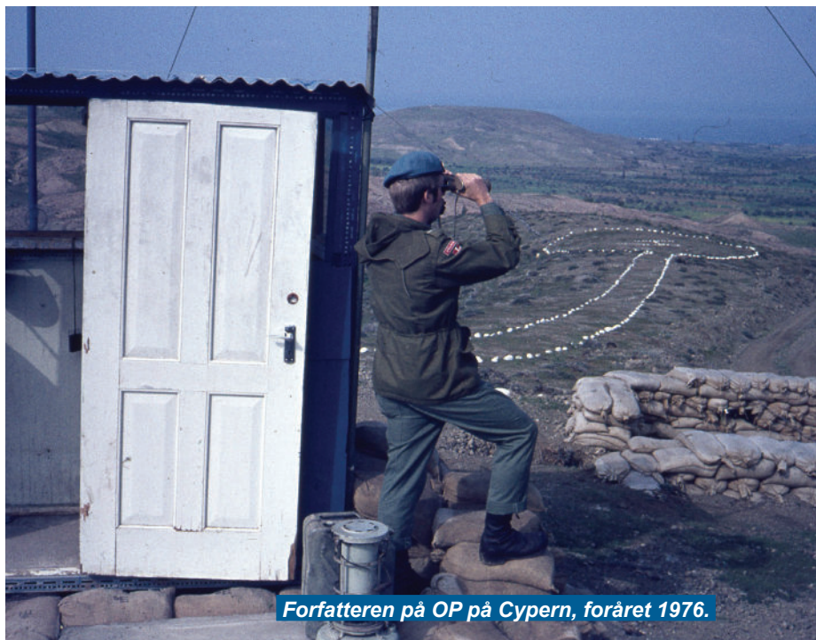
Forfatteren på OP på Cypern, foråret 1976.

"Vi er fire mand fordelt i to landrovare, der starter om morgenen fra Bravo-kompagniets lejr i Skouriossita. Det er blevet forår på øen, solen er ved at stå op, luften er krystal klar, temperaturen allerede oppe på cirka 20 grader og himlen helt blå. Vinteren har givet en del regn til den ellers så tørre ø i det østlige Middelhav, tæt på de store ørkenen mod syd i Nord-