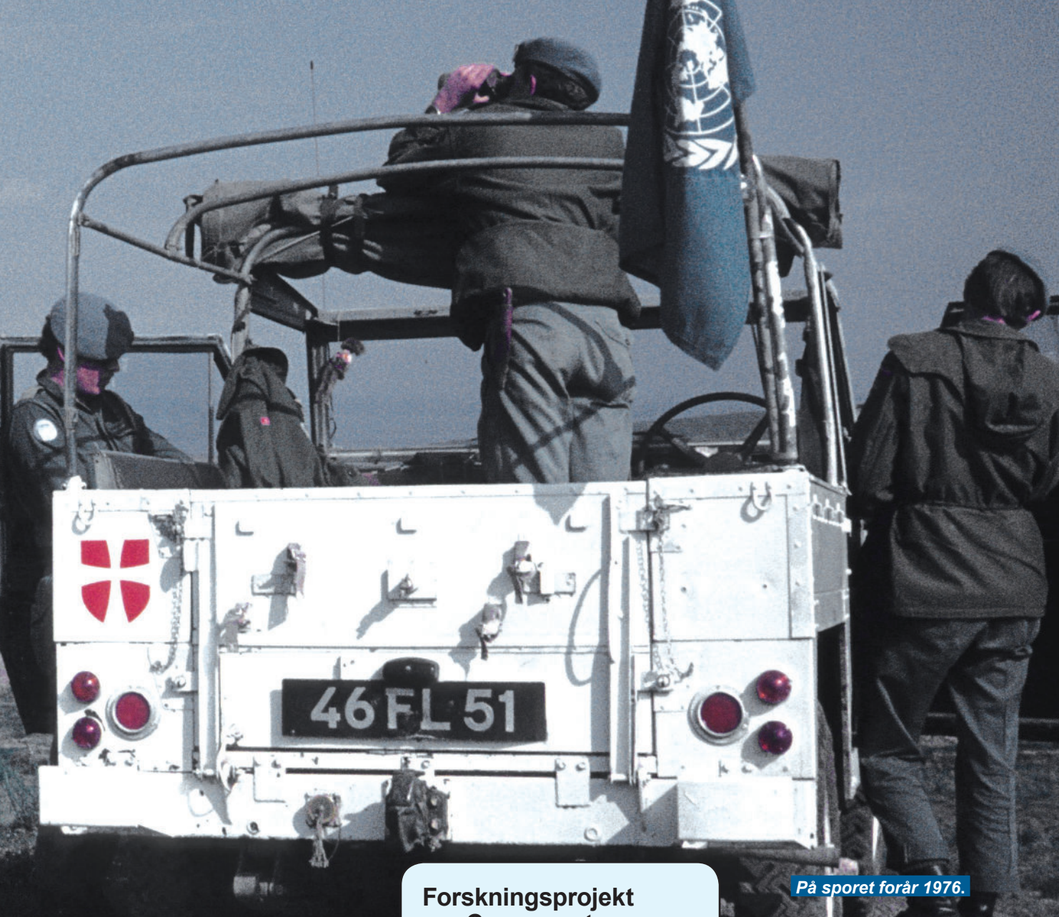
På sporet forår 1976.