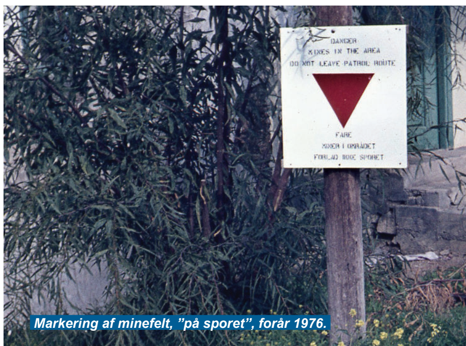
Markering af minefelt, "på sporet", forår 1976.

Turen går først stejlt op af bakkerne gennem et uhyggeligt spøgelseslandskab med små forladte, sønderskudte landsbyer, øde fåreskure, gennemhullede vandtårne, forfaldne kirker og moskeer,