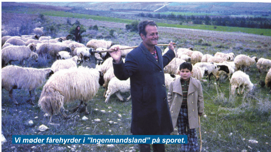
Vi møder fårehyrder i "Ingenmandsland" på sporet.

Flere bygninger, marker og gårdspladser er af Dancon markeret med tydelige skilte og snitzlinger, der signalerer fare.