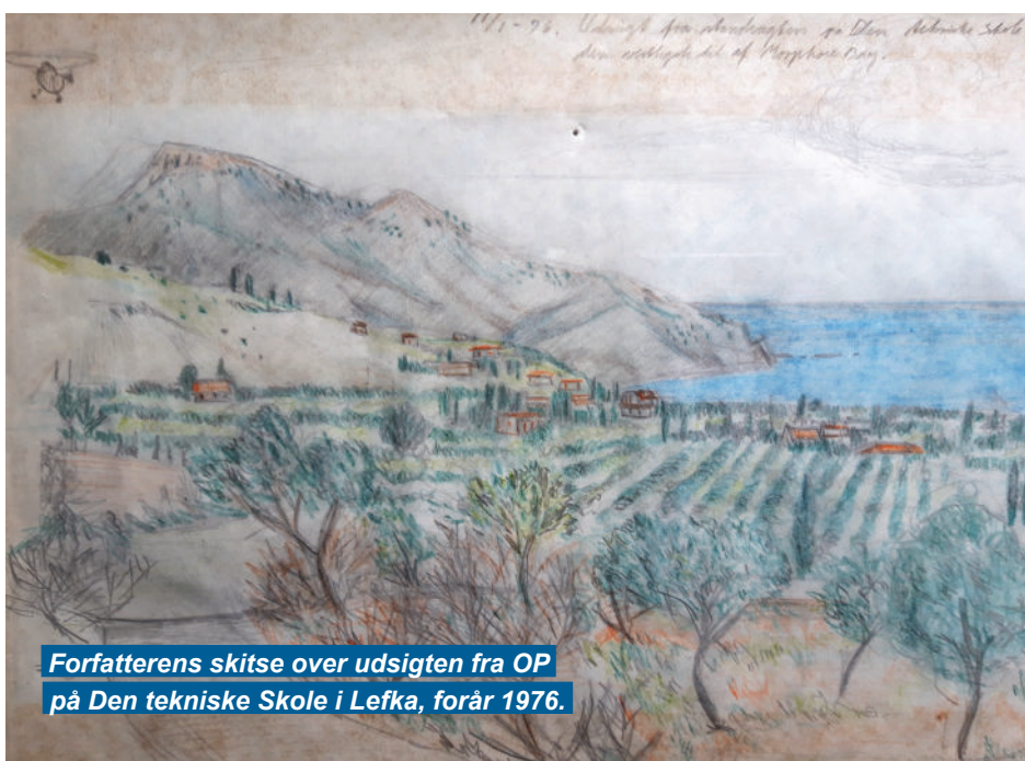
Forfatterens skitse over udsigten fra OP på Den tekniske Skole i Lefka, forår 1976.

Idagene op til den vagt, havde mine kammerater i flere tilfælde observeret uidentificerede personer, der angiveligt sneg sig rundt i skolens store afspærrede garage- og værkstedsområde. Det var under alle omstændigheder strengt forbudt for andre end DANCON personale at opholde sig på skolens område, så det skulle selvfølgelig standses. Min nattevagt bestod derfor af patruljering i, på og omkring skolen med en kraftig lygte, tændt walkie talkie og skarpladt maskinpistol. Det var virkelig en anspændt situation – alle sanser var skærpede, da jeg gik rundt og med lommelygten tjekkede det øde garage- og værkstedsområde, inde og ude. Det kulminerede, da jeg også observerede et par skikkelser løbe rundt i terrænet uden for garagerne. Skulle jeg råbe dem an eller ligefrem afgive et varselsskud? Jeg kaldte vagthavende på OP’en og spurgte hvad jeg skulle stille op, men inden jeg kunne gøre noget var de uindbudte gæster åbenbart løbet væk igen. Hvem de var, og hvad de ville, fandt vi aldrig ud af. Det kunne have været soldater fra de stridende parter – men måske også bare lokale indbrudstyre eller ballademagere. ■