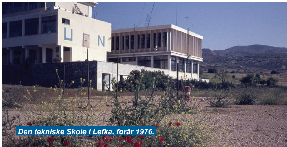
Den tekniske Skole i Lefka, forår 1976.

Det skete fx 1.-2. april 1976, hvor tyrkerne og grækerne havde en alvorlig træfning på DANCONs område. Det begyndte med at tyrkerne kørte frem over "linjen" i vores sektor og med maskingeværer afgav byger af skud mod de græsk-cypriotiske stillinger, ►